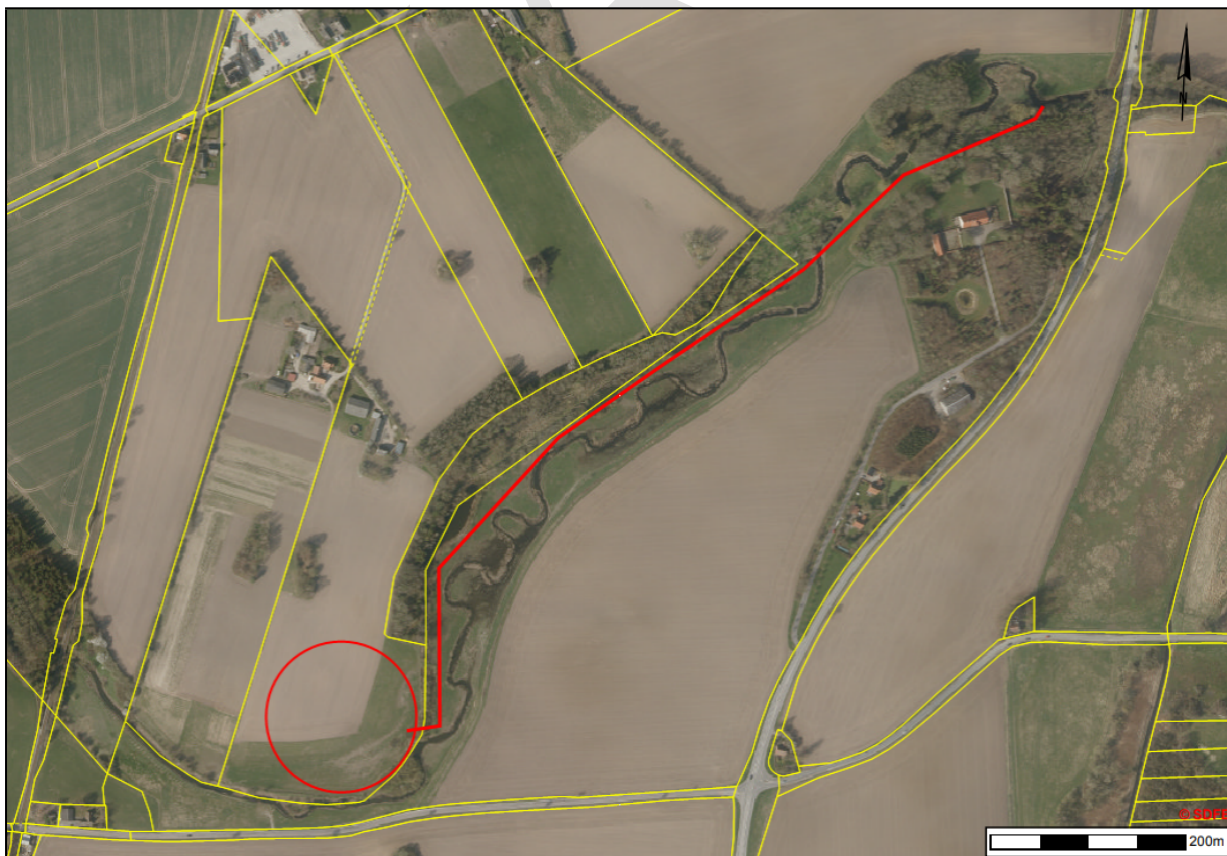
Figur 2: 2018 luffoto. Den røde cirkel markerer området, der er drænet på matrikel 1g Ll. Linde By, Hårlev ifm. projektet vedr. genslyngning af Tryggevælde Å. Den røde linje markerer rørledningen på matrikel 1a Tryggevælde Hgd., Karise, der leder drænvandet til udløb i Tryggevælde Å. Matrikelskel er angivet ved de gule streger. Målestok er angivet i nederste højre hjørne.